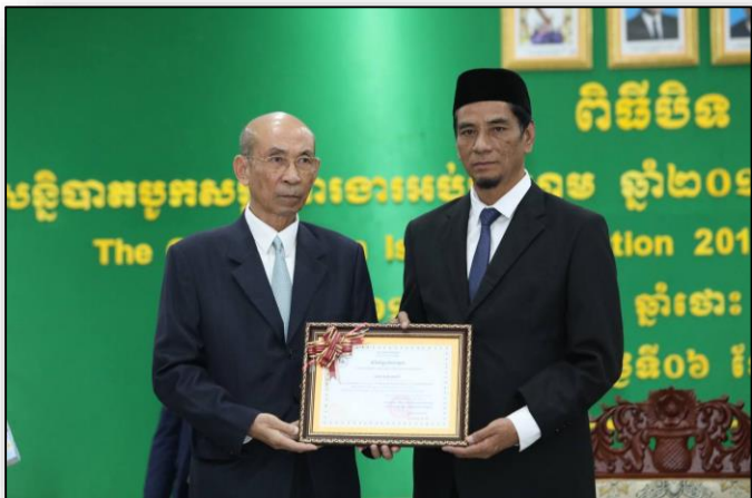
ការប្រគល់លិខិតសរសើរជូនតំណាងវ៉ាក្លិន