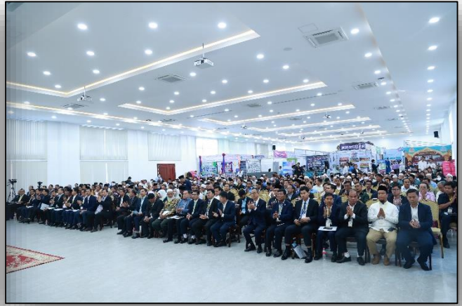
សុន្ទរកថាបើកមហាសន្និបាតដោយ ឯកឧត្តមណ្ឌិត អូស្មាន ហាស្យាន់ ទេសរដ្ឋមន្ត្រីទទួលបន្ទុកបេសកកម្មពិសេស