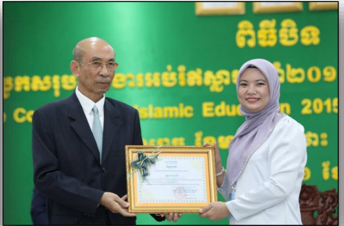
ការប្រគល់លិខិតសរសើរជូនតំណាងគណៈកម្មការ