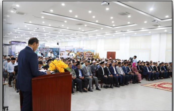
របាយការណ៍បូកសរុបមហាសន្និបាតដោយ ឯកឧត្តម ណុះ ស្មែរ រដ្ឋលេខាធិការ និងជាប្រធានគណៈកម្មការបច្ចេកទេសមហាសន្និបាត