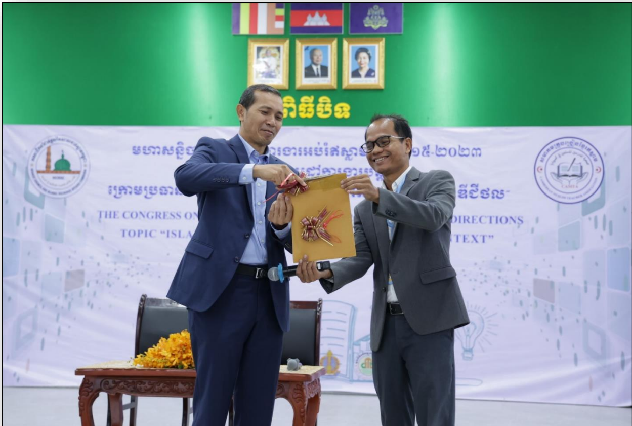
ការប្រកាសលទ្ធផលជ័យលាភីការតែងនិពន្ធខ្នុទ្ធព្រះ ដោយ ឯកឧត្តម ណុះ ស្កេះ រដ្ឋលេខាធិការ និងជាប្រធានគណៈកម្មការបច្ចេកទេស