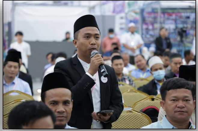
ការចូលរួមសួរសំណួរ និងលើកឡើងនូវមតិយោបល់ របស់អង្គមហាសន្និបាត ក្នុងវេទិការពិភាក្សាទី២