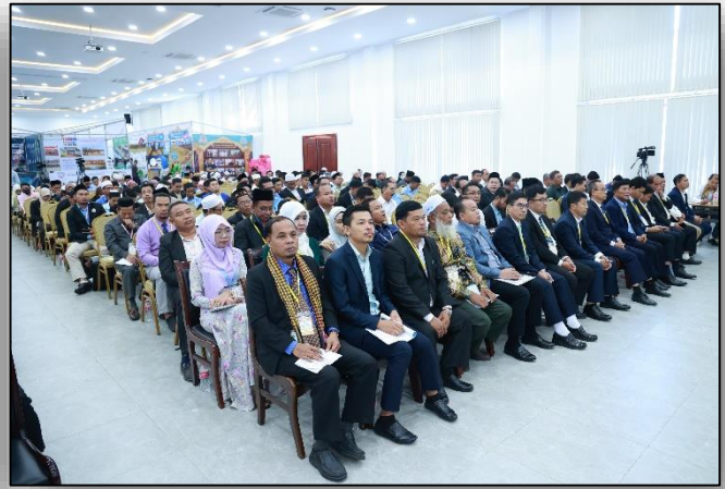
របាយការណ៍ស្ថាគមន៍ ដោយ ឯកឧត្តម លុះ ស្ទេះ រដ្ឋលេខាធិការ និងជាប្រធានគណៈកម្មការបច្ចេកទេសមហាសន្និបាត