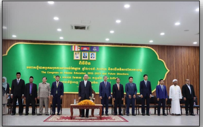
សន្ទរកថាថ្ងៃដំបូងក្នុងបិទមហាសន្និបាតដោយ ឯកឧត្តមបណ្ឌិតសភាចារ្យ ណាត ប៊ុន រឿន រដ្ឋលេខាធិការ ក្រសួងអប់រំ យុវជន និងកីឡា តំណាងដ៏ខ្ពង់ខ្ពស់ ឯកឧត្តមបណ្ឌិតសភាចារ្យ ឧបនាយករដ្ឋមន្ត្រី រដ្ឋមន្ត្រី ក្រសួងអប់រំ យុវជន និងកីឡា