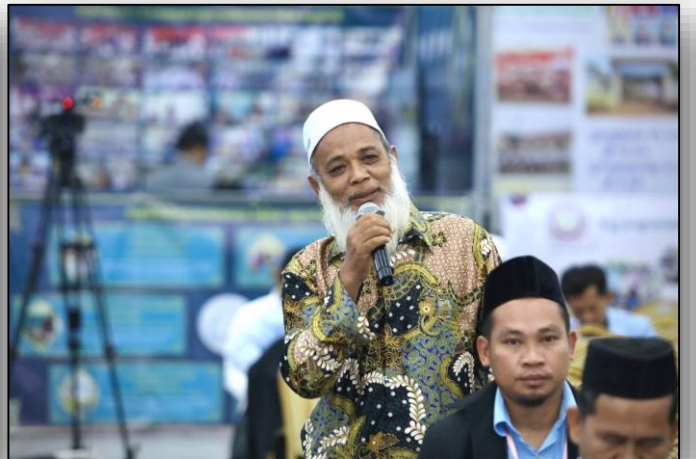
ការចូលរួមសួរសំណួរ និងលើកឡើងនូវមតិយោបល់ របស់អង្គមហាសន្និបាត ក្នុងវេទិកាពិភាក្សាទី១