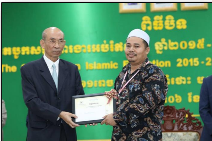
ជ័យលាភីលេខ១ ផ្នែកតែងនិពន្ធខុទ្ទពៈ