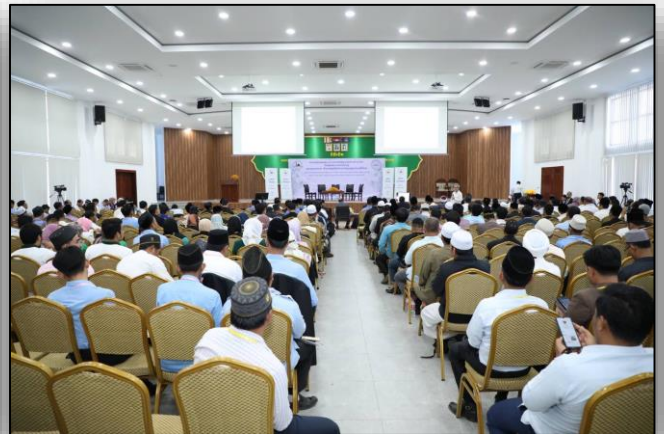
បទអន្តរាគមន៍ស្តីពី៖ បទពិសោធន៍ការធ្វើកំណែទម្រង់វិស័យអប់រំនៅកម្ពុជា ដោយ លោក កែវ សារ៉ាត់